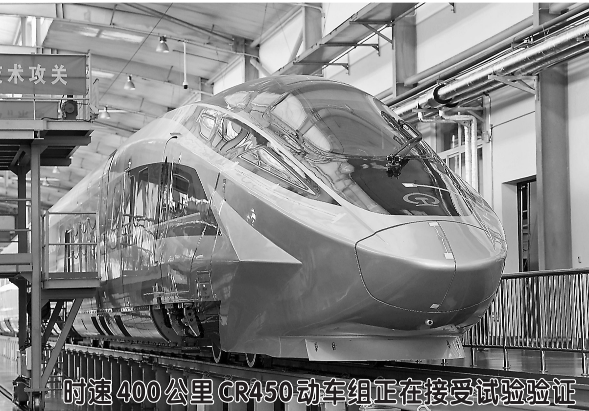
这是铁科院国家铁道试验中心接受试验验证的CR450动车组样车(2月25日摄)。近日,运营时速400公里的高铁列车CR450动车组样车在北京发布。目前相关团队正在开展一系列科学试验和性能验证,为动车投入商业运营创造条件。

“一方面,我们注重加强对本土本土人才的培养,通过加强农民技术技能的培训,推进乡村工匠培育工程等措施,壮大农村各类专业人才和实用人才队伍。另一方面,注重外部人才引进,通过营造良好的创业环境,实施一批基层服务项目等措施,为乡村发展引进一批急需的人才。”韩文秀说,要用乡村广阔天地的发展机遇吸引人,用乡村田园宜居的优美环境留住人,解决好职业发展、社会保障后顾之忧,让年轻人在农村留得住,发展得越来越好。