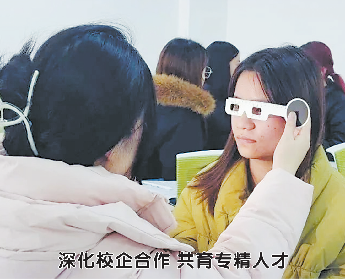
深化校企合作 共育专精人才

本报讯（记者 胡云华）2025年春运期间，菏泽牡丹机场运送旅客10.3万人次，航班起降782架次；2月4日（正月初七）迎来客流高峰，日客流量达3472人次。 菏泽飞往广州、深圳、上海等地为热门航线，航班客座率达90%以上，海口、哈尔滨等地客流增幅较大，同比分别增长60.5%和27.5%。联合南航将菏泽往返广州航班增加至每天两个班次；启用X256临时航线，满足运力需求。航班放行正常率94.12%，较去年同期增长12.44%。此外，近2000件催花牡丹从菏泽“坐”飞机抢“鲜”全国各地年宵花市场。 春运期间，机场安检部门查获各类违禁、限制物品2000余件，其中烟花爆竹23起，3人藏匿火种被移交公安机关处理，保障航空春运“零”隐患。