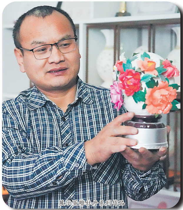
展示蛋雕牡丹系列作品