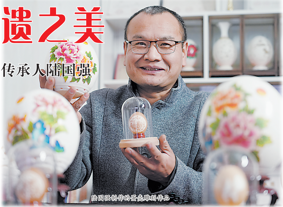
陆国强创作的蛋壳雕刻作品