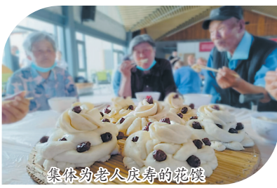
集体为老人庆寿的花馍