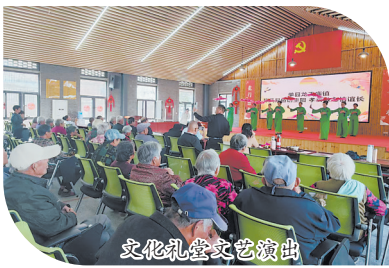
文化礼堂文艺演出