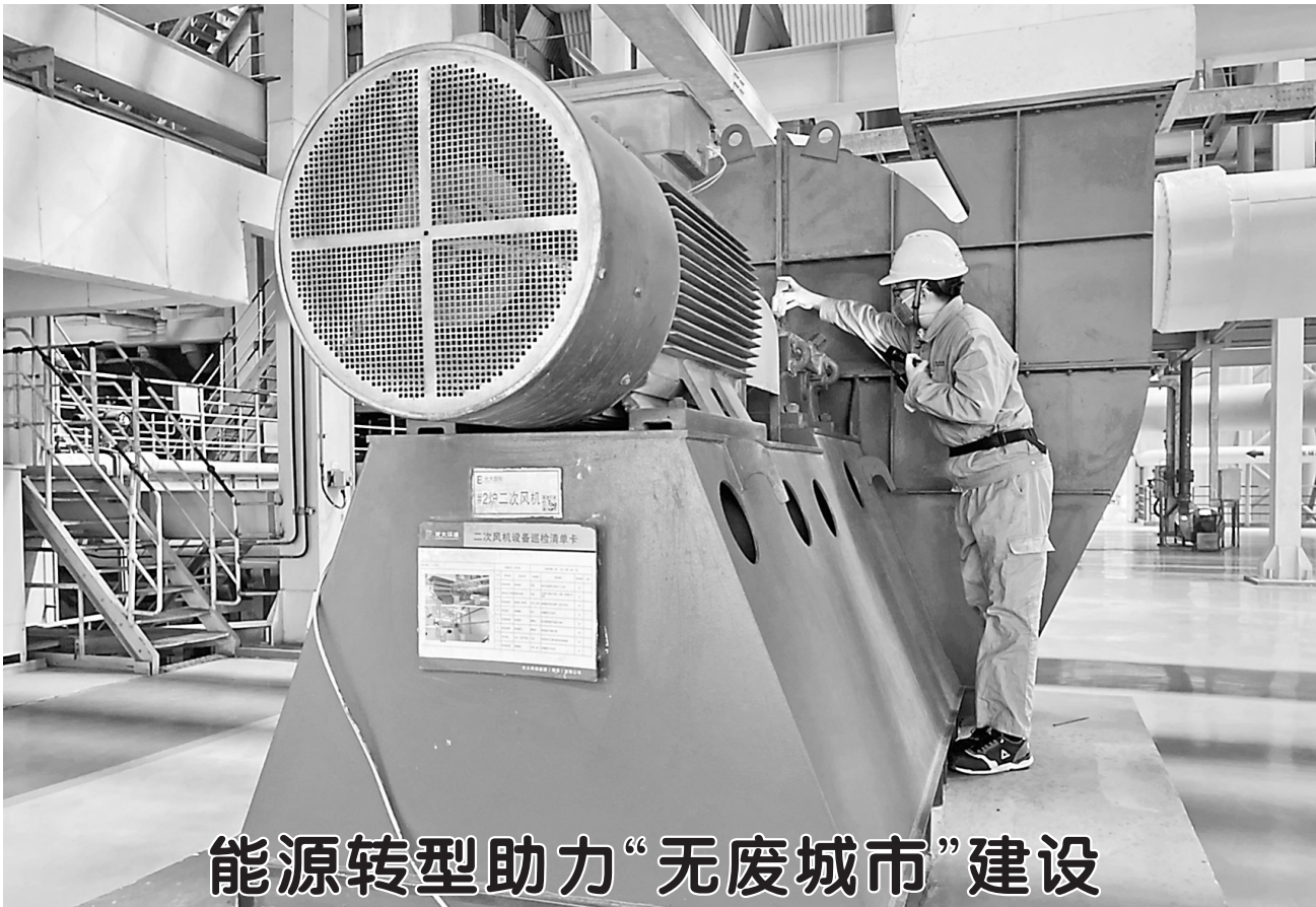
能源转型助力“无废城市”建设

2月27日，牡丹区光大环保能源(菏泽)有限公司员工正在巡检垃圾焚烧设备。2024年，该公司共处理生活垃圾34.26万吨，产生绿色电力1.32亿度。据统计，我市每年约产生生物质秸秆和林木废弃物1150万吨、畜禽粪污1200万吨、生活垃圾230万吨。近年来，我市大力推进能源清洁高效利用，加快“无废城市”建设，推进绿色低碳发展。目前，全市已并网生物质、垃圾发电厂19座，总规模47.2万kw。