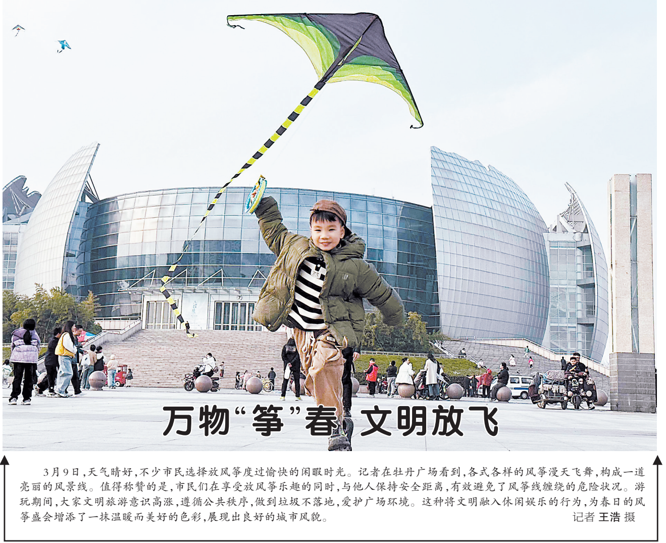
3月9日,天气晴好,不少市民选择放风筝度过愉快的闲暇时光。记者在牡丹广场看到,各式各样的风筝漫天飞舞,构成一道亮丽的风景线。值得称赞的是,市民们在享受放风筝乐趣的同时,与他人保持安全距离,有效避免了风筝线缠绕的危险状况。游玩期间,大家文明旅游意识高涨,遵循公共秩序,做到垃圾不落地,爱护广场环境。这种将文明融入休闲娱乐的行为,为春日的风筝盛会增添了一抹温暖而美好的色彩,展现出良好的城市风貌。