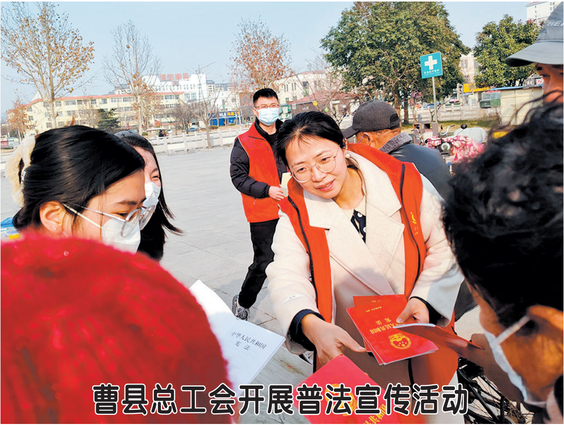
曹县总工会开展普法宣传活动

近日，曹县总工会在县人民广场举办了一场以“践行雷锋精神，以法为盾，为你撑起权益保护伞”主题的普法活动。活动中设立法律咨询台，工作人员结合《中华人民共和国劳动合同法》和《中华人民共和国工伤保险条例》，对职工提出的问题进行分析，并手绘“维权流程图”，详细讲解了相关法律法规要点。此外，活动还特别设置了法律知识有奖问答环节，进一步加深了职工对法律知识的理解和记忆。