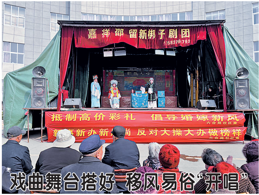
戏曲舞台搭好 移风易俗“开唱”