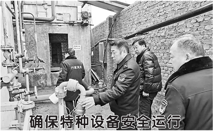
确保特种设备安全运行

此次改造工程针对黄河滩区冬小麦——夏玉米一年两熟的种植模式(复种指数达 1.7)进行了科学设计，建设了现代化的节水灌溉设施，提高了水资源的利用效率。