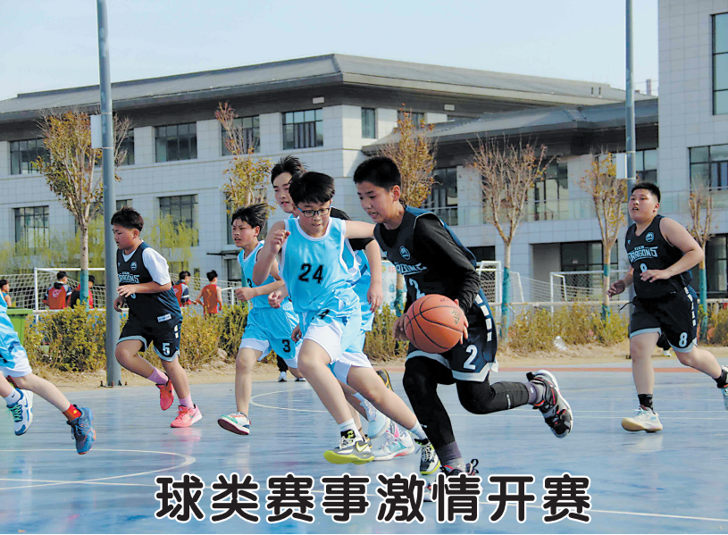
球类赛事激情开赛

3月22日，鲁西新区中小学体育艺术节球类赛事在菏泽市曹州武校开赛。据了解，来自鲁西新区各中小学的31支队伍参加了此次比赛，涵盖排球、篮球、足球、乒乓球四个项目，旨在全力营造积极阳光、充满活力的校园体育文化氛围。赛场上，队友们团结协作、顽强拼搏，在热烈欢快的氛围里尽情感受球类运动的独特魅力。