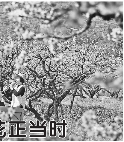
3月24日,游人在浙江省临海市白水洋镇桃源村休闲。春分过后,各地春意融融。人们纷纷来到户外踏青赏花,乐享春光。