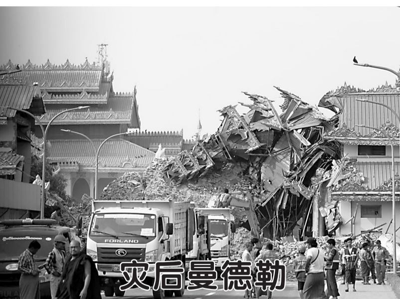
这是3月29日在缅甸曼德勒拍摄的倒塌的建筑。