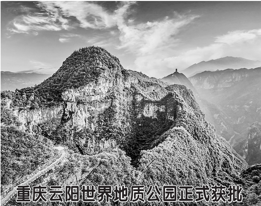
重庆云阳世界地质公园正式获批

因菏泽市人民路北延(鄄城鄄七路至国花大道)工程施工,需对纬一路(小留路口至马洪路段)采取半幅施工、半幅通行的交通管制措施,施工期间(2025年4月15日—2025年4月24日)四轴及以上的货车禁止通行,请绕行。 特此公告 牡丹区公路事业发展中心 菏泽牡丹路桥工程有限公司 2025年4月12日