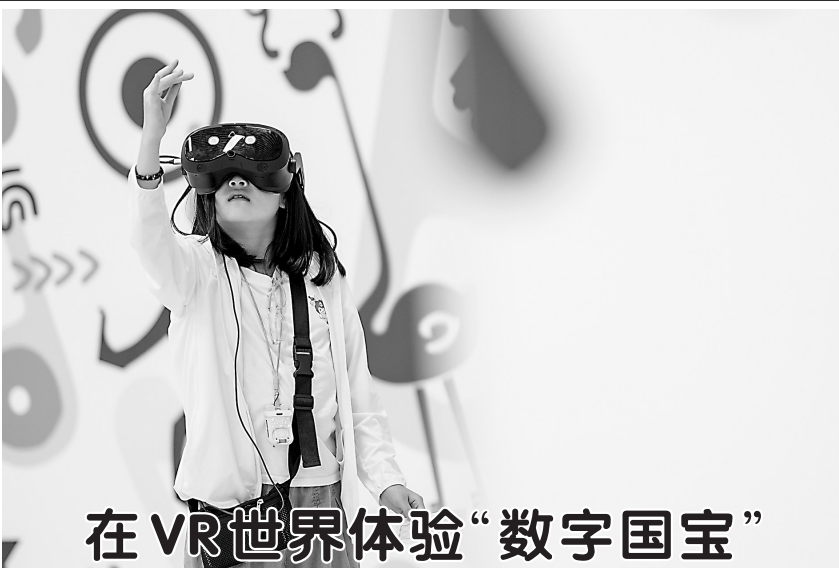
在VR世界体验“数字国宝”

4月28日，村民在贵州省从江县加榜梯田查看稻田蓄水情况。 时下，位于贵州省黔东南苗族侗族自治州从江县加榜乡的加榜梯田进入春耕农忙时节。