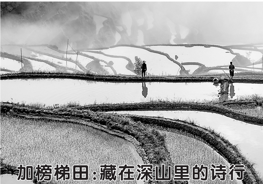
加榜梯田：藏在深山里的诗行

新华社华盛顿4月28日电 美国海军28日通报，一架F/A-18E“超级大黄蜂”战斗机从“哈里·杜鲁门”号航母甲板坠落。 美国海军发表声明说，这架战机被牵引移动时，牵引车操作人员失去对其的控制，导致战机与牵引车坠入海中。美国海军表示，正在调查这一事件，一名水手受轻伤。 美国有线电视新闻网援引美国官员的话报道，初步报告显示，在红海水域执行任务的“哈里·杜鲁门”号航母事发时正在急转弯，以躲避胡塞武装火力攻击。 此外，一名美国官员28日表示，3月15日以来，美军在也门地区损失7架MQ-9“死神”无人机。 美国3月15日开始对也门胡塞武装进行大规模空袭。MQ-9“死神”无人机既能执行侦察监视任务，也可挂载导弹打击地面目标。每架“死神”造价高达3000万美元。 这名官员没有说明无人机损失的具体原因。胡塞武装4月19日曾说，当天用地空导弹击落一架“死神”。