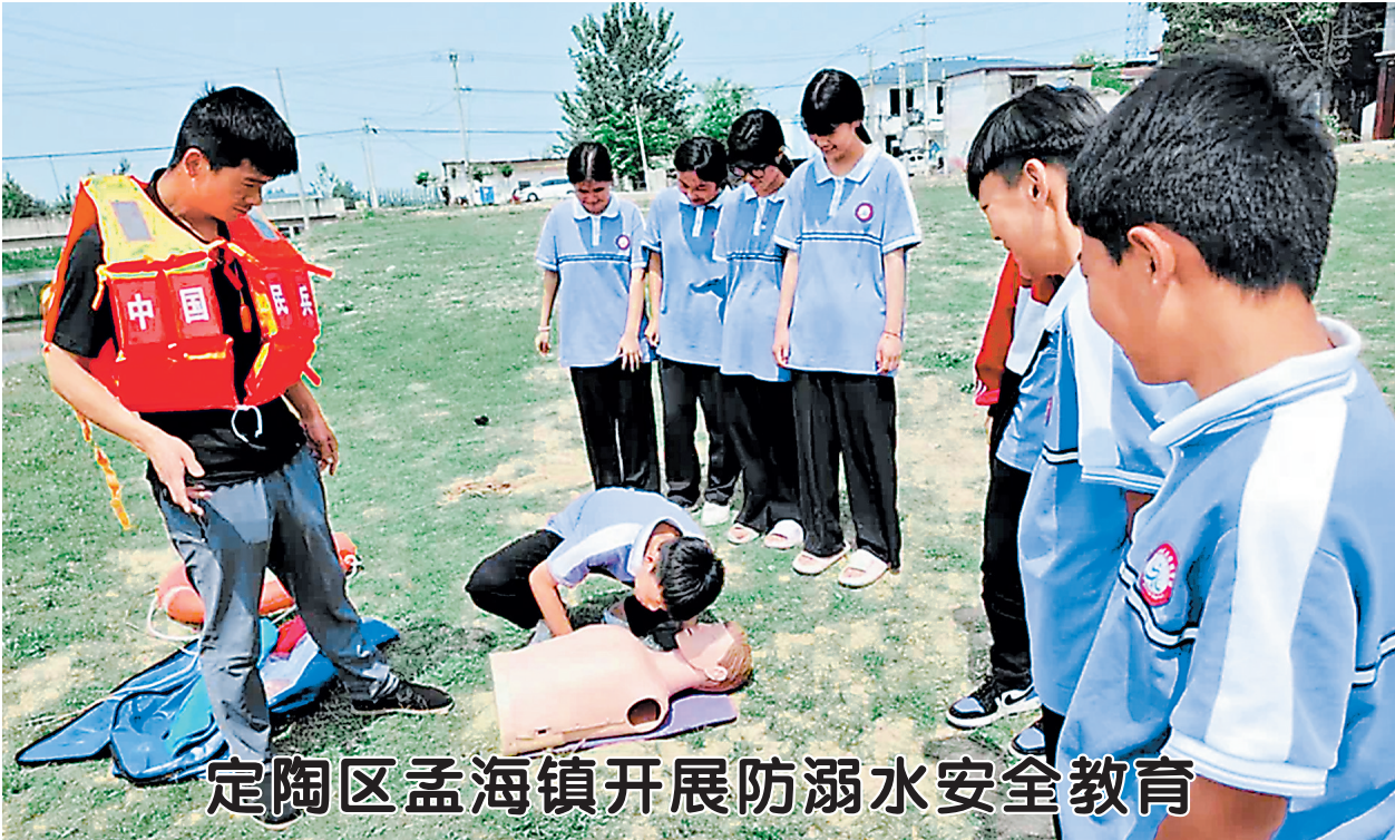
定陶区孟海镇开展防溺水安全教育

▲5月26日,定陶区孟海镇开展“珍爱生命 预防溺水 从我做起”主题教育。活动中,工作人员结合案例讲解防溺水知识,剖析危险水域与自救方法;现场演示心肺复苏、人工呼吸等应急操作,并指导学生分组开展呼救、救援等情景模拟演练。学生通过理论学习 and 实操练习,掌握了防溺水技能,提升了安全意识。