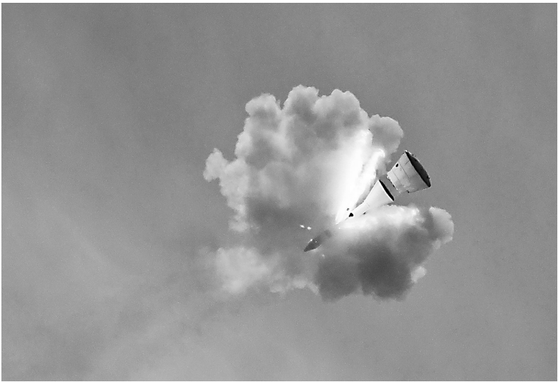
6月17日，我国在酒泉卫星发射中心成功组织实施梦舟载人飞船零高度逃逸飞行试验，标志着我国载人月球探测工程研制工作取得新的重要突破。