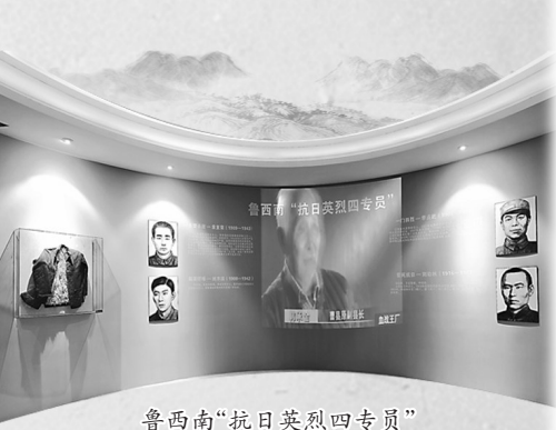
鲁西南“抗日英烈四专员”