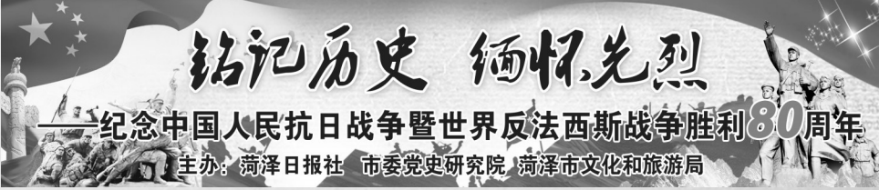
——纪念中国人民抗日战争暨世界反法西斯战争胜利80周年