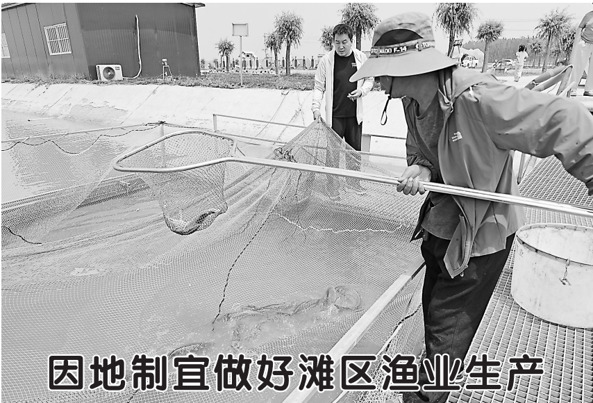
因地制宜做好滩区渔业生产

本报讯（记者 张啸）6月25日，北京齐鲁文化促进会与菏泽杏林天成中医诊所战略合作暨“上医合作伙伴”颁牌仪式在我市举行。双方将共同深耕中医药文化沃土，推动“上医治未病”理念创新实践，为健康中国建设注入新动力。 据悉，北京齐鲁文化促进会长期致力于弘扬优秀传统文化，其旗下北京上工中医