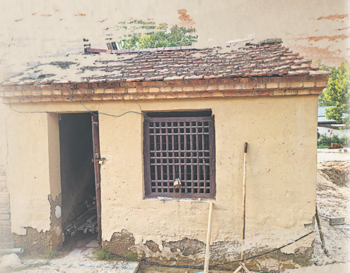
修缮的伙房旧址(里面的灶台也曾是一个隐蔽的地道出入口)

着历史的回响。这里见证了从一把大刀到星火燎原的觉醒之路,更充满了党群同心、军民一体的力量之源。