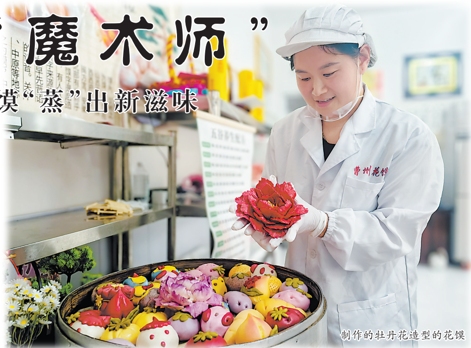
制作的牡丹花造型的花馍