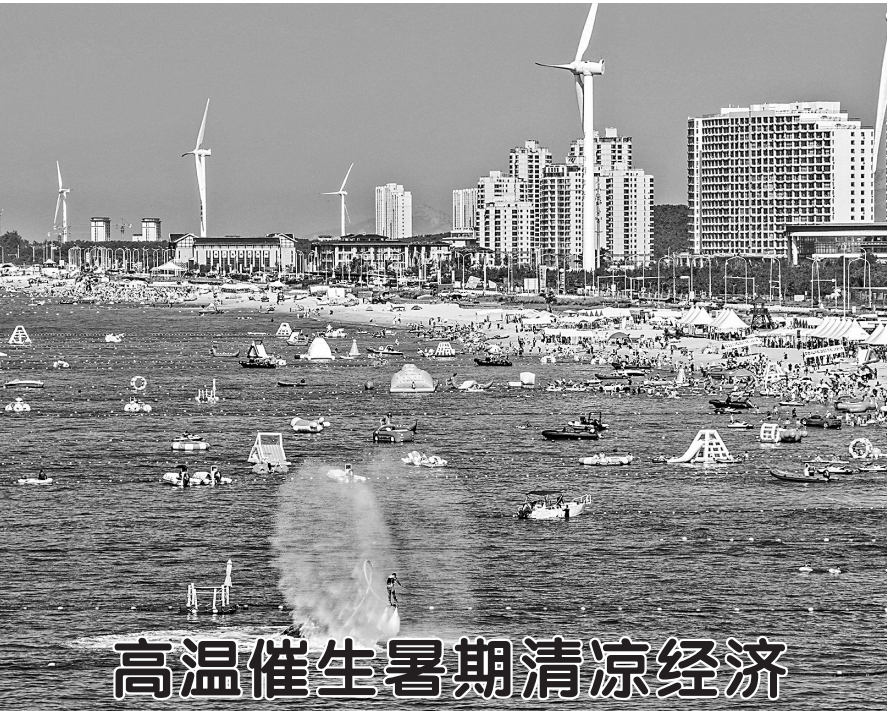
高温催生暑期清凉经济

“从最新的气象会商结果来看，发射窗口天气满足火箭发射最低气象条件。”文昌航天发射场甘思旧介绍。