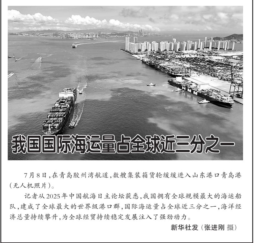
我国国际海运量占全球近三分之一

7月8日，在青岛胶州湾航道，数艘集装箱货轮缓缓进入山东港口青岛港（无人机照片）。