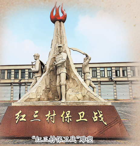
“红三村保卫战”雕塑

1939年，中共鲁西南地委在刘岗村成立，成为鲁西南抗日根据地的“心脏”。刘岗、曹楼、伊庄三村呈“品”字相望，相距不过一二里路，互为犄角、攻守相依。因日军经常在地图上用红笔把