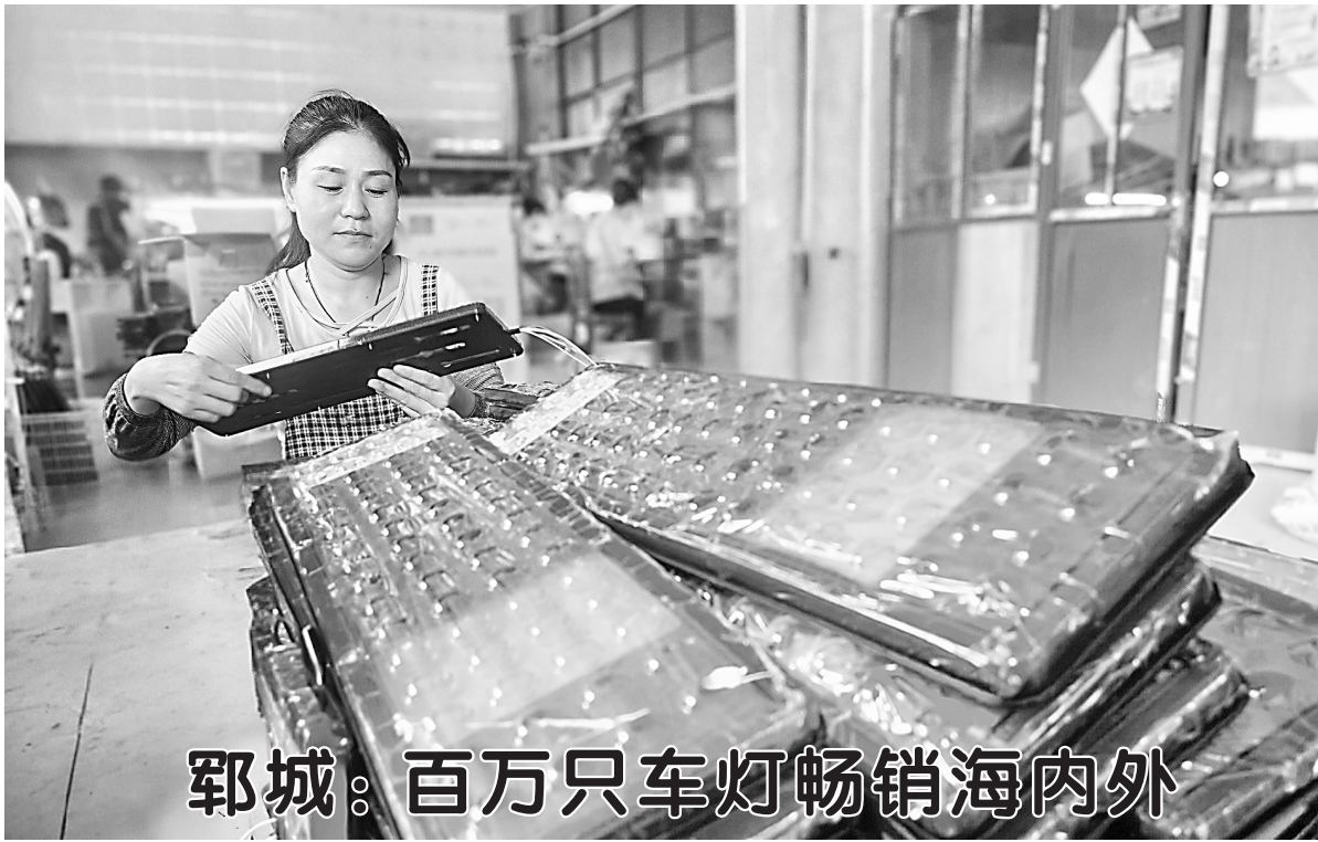
郓城：百万只车灯畅销海内外

8月5日,在曹县家具联盟产业园泰诺新型材料有限公司生产车间,技术人员正在操作设备进行产品生产作业。据了解,该公司占地面积118亩,建有标准化车间6座,主要生产三聚氰胺浸渍纸等产品,并引进国内先进的浸胶生产线6条、印刷线11条、压机15台,年产能达4000万张,主要销往国内各大木制品企业,带动就业200余人。