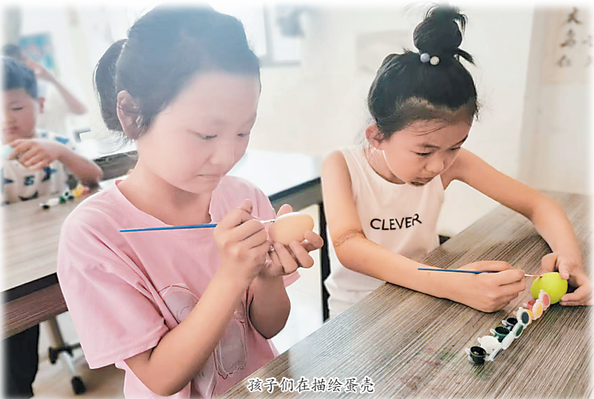
孩子们在描绘蛋壳