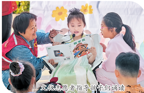
文化志愿者指导孩子们诵读