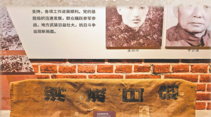
百姓支前用的粮食布袋