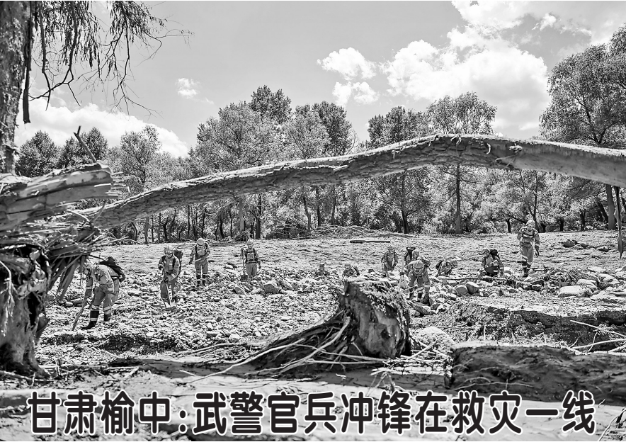
甘肃榆中:武警官兵冲锋在救灾一线