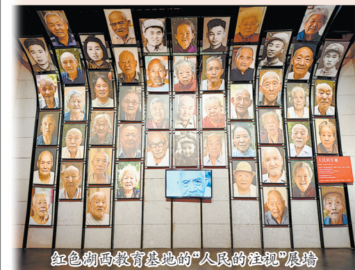
红色湖西教育基地的“人民的记忆”展馆

1942年12月，日军石井师团对湖西抗日根据地实行残酷的冬季大“扫荡”。湖西专署专员李贞乾为掩护机关、部队和百姓突围，以自身为诱饵吸引敌军主力攻击，最终壮烈牺牲。在他的掩护