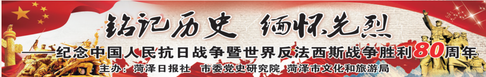
——纪念中国人民抗日战争暨世界反法西斯战争胜利80周年