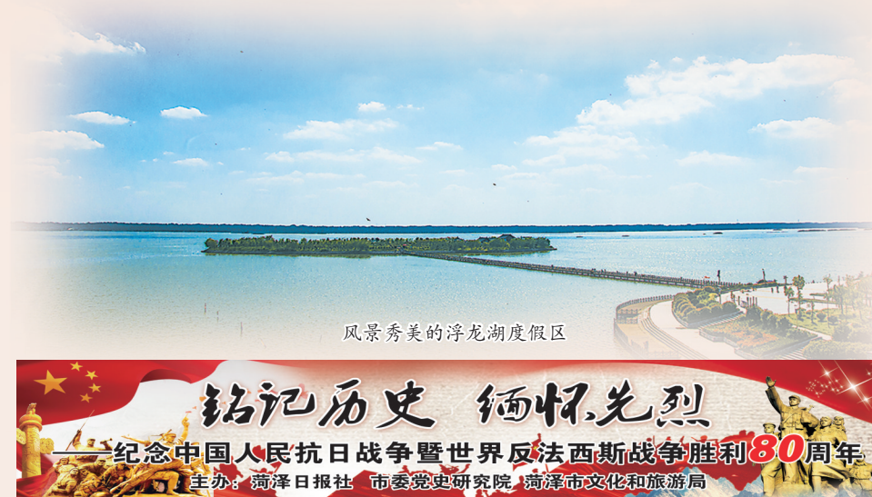
风景秀美的浮龙湖度假区