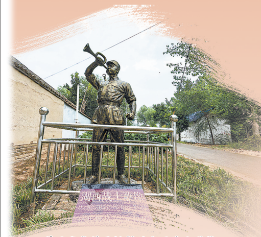
单县张集镇马桥村的湖西战士雕像

立秋后的鲁西南平原，玉米地绿浪翻滚，恰如八十多年前掩护抗日先辈的青纱帐。八十载光阴荏苒，当年的战火硝烟早已散尽，但湖西大地上镌刻的英雄史诗，正化作单县高质量发展的前行动力。湖西抗战精神如同深埋地下的根系，始终滋养着这片热土。8月11日，记者来到单县，感受这片英雄土地上的烽火印记。