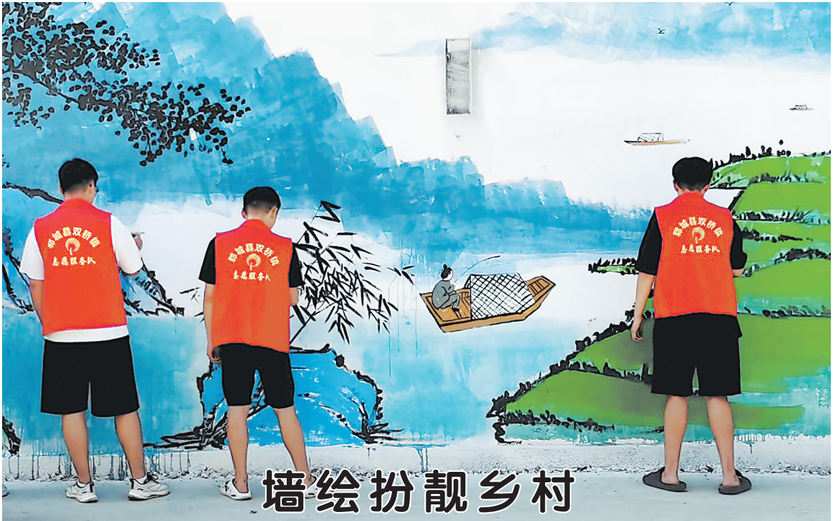
8月12日，郓城县双桥镇中街村的几条巷道内格外热闹。20余名返乡大学生志愿者手持画笔与颜料，俯身于斑驳的墙面，专注地勾勒线条、填充色彩，用艺术为村庄“梳妆”。 此次墙绘活动由双桥镇组织返乡大学生志愿者实施。活动不仅以艺术形式美化村容村貌，更巧妙融入了乡村振兴、移风易俗等主题元素。筹备阶段，大学生们深入对接村干部与村民，充分挖掘中街村的农耕文化、民俗特色及发展愿景，精心设计出多套主题墙绘方案。

本报讯（记者 李若生）近日，牡丹区胡集镇农家书屋内书香氤氲，孩子们围坐在一起，在大学生志愿者的带领下翻开《小兵张嘎》《闪闪的红星》，共同追寻“八一”军旗背后的热血故事。这是牡丹区以红色文化滋养青少年心灵的生动缩影，也是该区扎实推进“护苗”行动、精心构筑青少年精神家园的务实举措。 红色基因传承是铸魂育人的核心。在牡丹区南城街道“小荷学堂”，志愿者们巧妙融合社会科学普及与红色教育，通过史料解读和故事讲述，引导青少年阅读红色经典，感悟信仰力量。胡集镇则依托“红色书香庆‘八一’”阅读活动，将农家书屋打造成乡村少年的“精神充电站”，让红色文化浸润心田。 牡丹区将培养良好阅读习惯作为“护苗”的长远之策。在高庄镇“阅读点亮未来 书香陪伴成长”活动中，区社科联志愿者围绕“亲子阅读是最好的陪伴”主题，通过绘本讲解激发儿童阅读兴趣，培养思辨能力。村民姜先生感慨道：“让孩子爱上阅读，家长更要以身作则。” 营造清朗文化环境是“护苗”的关键环节。牡丹区委宣传部、区社科联深入推进“‘护苗’·绿书签行动”，将其与全民阅读、学校教育深度融合。在沙土镇“小荷学堂”，志愿者们用生动的语言教会孩子们识别盗版书籍与有害信息，引导他们自觉抵制非法出版物。同时，精选优秀读物组织共读分享，解答成长困惑，为孩子们筑起坚实的安全“防护墙”。 今年以来，共青团牡丹区委联合区社科联精准发力，依托“百万大学生进社区”“小荷学堂”等平台，持续优化机制、拓展领域，推动大学生志愿服务向精准化、常态化、长效化发展。截至目前，全区已累计服务青少年8000余人次，培育基层治理“青年合伙人”40余名，为青少年成长注入青春力量。