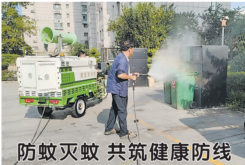
防蚊灭蚊 共筑健康防线

强，既解答了日常工作中的困惑，又引入了前沿康复理念和方法，为今后更好地服务残疾儿童提供了有力支撑。 下一步，定陶区残联将以此次培训为契机，持续深化“医教结合+融合教育”模式，将人才队伍建设作为提升康复服务质量的关键抓手，通过常态化专业培训、搭建交流平台、引进先进技术等措施，全面提升康复人才队伍综合素养，推动残疾儿童康复服务从“有”向“优”迈进，为辖区特殊儿童创造更优质的成长发展环境。