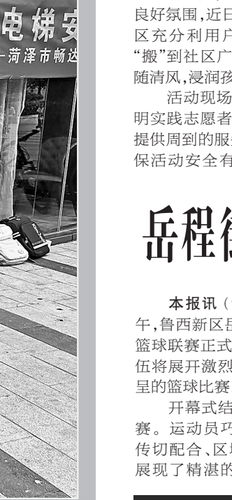
为筑牢居民乘梯安全网，提高居民的安全意识和自我保护能力，近日，鲁西新区综合行政执法局在菏泽中心小区组织开展电梯安全知识进社区宣传活动。活动中，工作人员结合实际案例，向居民宣传电梯日常使用注意事项、常见故障的应急处理方法，并讲解了特种设备的相关法律法规和安全管理要求。