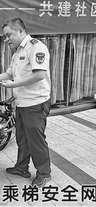
为筑牢居民乘梯安全网，提高居民的安全意识和自我保护能力，近日，鲁西新区综合行政执法局在菏泽中心小区组织开展电梯安全知识进社区宣传活动。活动中，工作人员结合实际案例，向居民宣传电梯日常使用注意事项、常见故障的应急处理方法，并讲解了特种设备的相关法律法规和安全管理要求。