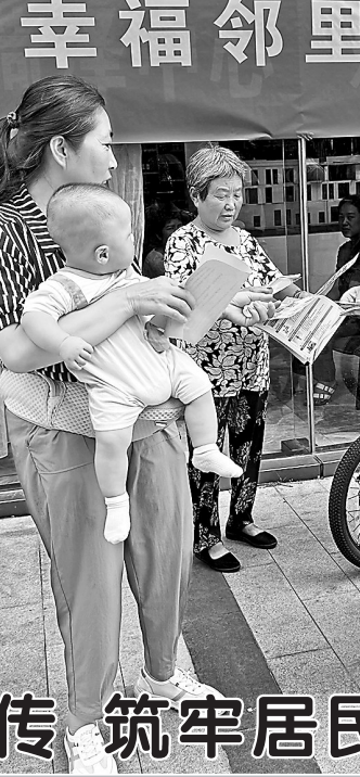
为筑牢居民乘梯安全网，提高居民的安全意识和自我保护能力，近日，鲁西新区综合行政执法局在菏泽中心小区组织开展电梯安全知识进社区宣传活动。活动中，工作人员结合实际案例，向居民宣传电梯日常使用注意事项、常见故障的应急处理方法，并讲解了特种设备的相关法律法规和安全管理要求。