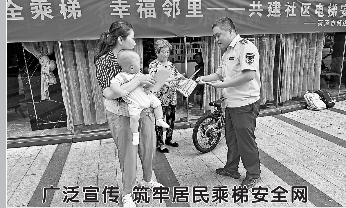
为筑牢居民乘梯安全网，提高居民的安全意识和自我保护能力，近日，鲁西新区综合行政执法局在菏泽中心小区组织开展电梯安全知识进社区宣传活动。活动中，工作人员结合实际案例，向居民宣传电梯日常使用注意事项、常见故障的应急处理方法，并讲解了特种设备的相关法律法规和安全管理要求。