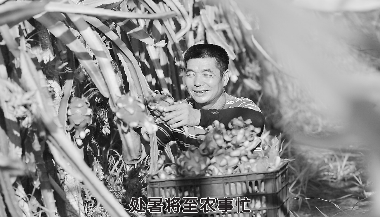
8月22日，在江西省宜春市万载县康乐街道里泉村火龙果基地，果农在采收成熟的火龙果。处暑节气将至，农民抢抓农时开展农事劳作。

尊敬的被征收居民： 牡丹区2018—7号地块回迁安置在中铭学府6#(规划楼号为10#)、8#、11#(规划楼号为5#)楼已建设完成，根据《菏泽市牡丹区政府办公室关于优化安置房、“保交楼”项目验收交付的实施意见》(荷区政办发[2023]28号)要求取得了工程质量鉴定符合设计和标准规范要求 的报告（编号：2023—HZ—0449、2025—JDB—0028、2025—JDB—0025）和消防安全合格评估报告(编号:2025—06HAXFPG002、2025—08HAXFPG001)，依据相关规定，即日起开展交房结(截)算工作。为方便大家办理交房手续，现将有关事项通知如下： 一、交房办理时间：2025年8月20日—2025年8月23日。 二、交房办理地点：中铭学府小区物业办公室。 三、交房需提供的证件资料 1、《房屋征收产权调换协议书》原件； 2、《房屋征收产权调换补充协议书》原件； 3、协议上所载明的所有被征收人身份