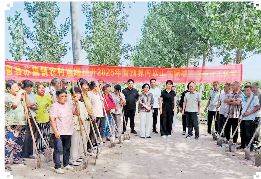
近日,曹县苏集镇农村道路提升2025年省预算内以工代赈项目开工。项目按照“农村公益性基础设施建设+劳务报酬发放+就业技能培训+公益性岗位设置”综合赈济模式,建设村内道路基础设施,推动项目区农村生产生活条件和发展环境明显改善。项目结合所需劳动技能,采取“培训+上岗”的模式,鼓励项目区群众积极参与项目建设与监督。

“环境整治不是‘一阵风’,而是‘持久战’。”倪集街道党工委副书记张海燕表示,今后将以此次专项行动为契机,建立健全党群服务中心长效管理机制。制定《倪集街道党群服务中心日常保洁管理制度》,明确各村保洁人员职责与保洁频次,确保卫生问题“及时发现、及时处理”;开展“党员带头护环境”志愿服务活动,组织党员定期对党群服务中心环境进行维护,并引导村民养成良好的卫生习惯,共同营造整洁、舒适、文明的服务环境。 记者 毛慎沛