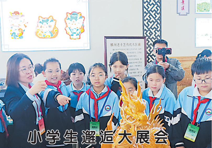
小学生邂逅大展会

▲9月19日至9月21日,在第20届中国林产品交易会举办期间,跨境电商成为展会关注的焦点,为我市林业企业拓展国际市场注入新动力。图为本地企业家正与跨境电商平台代表进行业务洽谈。