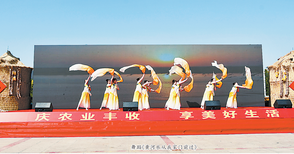
舞蹈《黄河水从我家门前过》