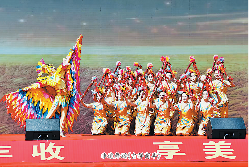
非遗舞蹈《吉祥商羊》