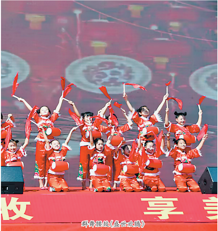
群舞腰鼓《盛世欢腾》