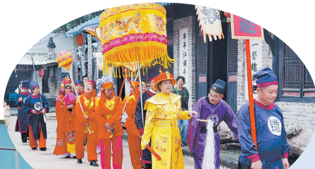
林台民俗文化村景区曲艺表演