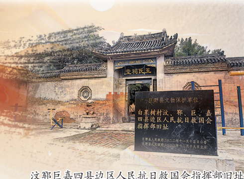
汶鄄巨嘉四县边区人民抗日救国会指挥部旧址