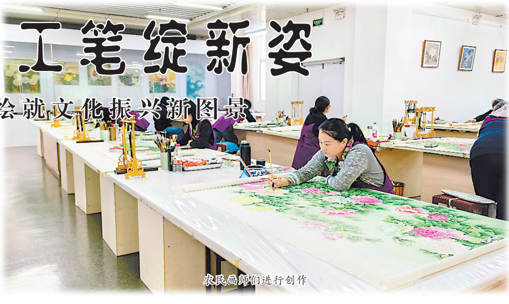
农民画师们进行创作