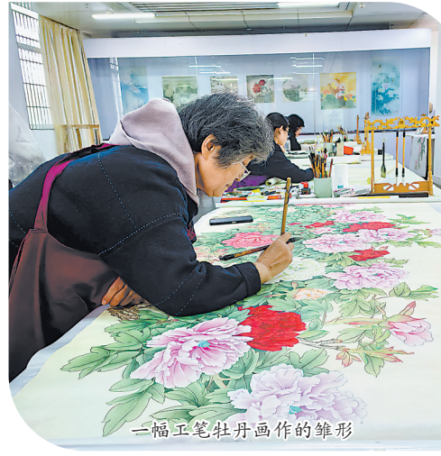
一幅工笔牡丹画作的雏形