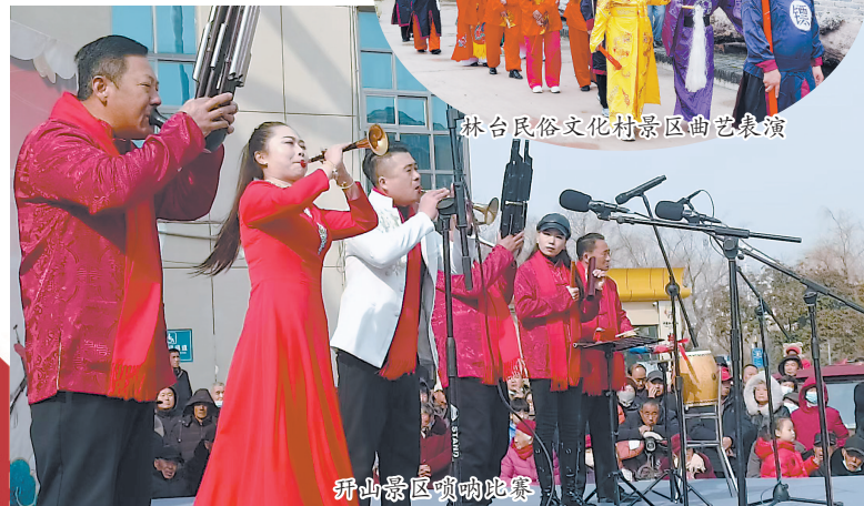
升山景区唢呐比赛