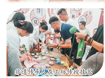
非遗传承人正在传授技艺