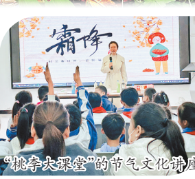
“桃李大讲堂”的节气文化讲座