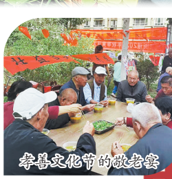
春暮文化节敬老宴