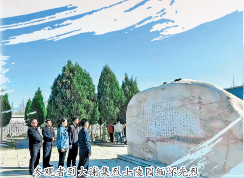
参观者到大谢集镇烈士陵园缅怀先烈。

1941年6月,巨野南部的麦田一片金黄。八路军教导三旅九团一营340名战士来到陈海、德化集一带,执行掩护群众麦收的任务。6月7日凌晨2时许,紧急情报传来:附近数县日军频繁调动,有合围一营的迹象。拂晓时分,部队迅速转移至3里外的杨楼村。 一营立即部署兵力,各连紧闭寨门,抢修简易工事。全村百姓也迅速行动起来,协助勤务工作。