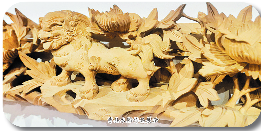
曹县木雕作品展示