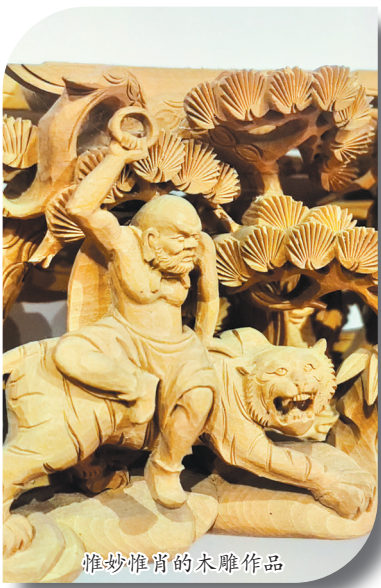
惟妙惟肖的木雕作品