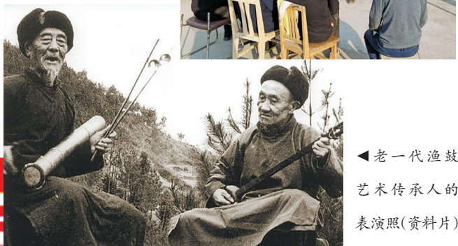
▶老一代渔鼓艺术传承人的表演照(资料片)