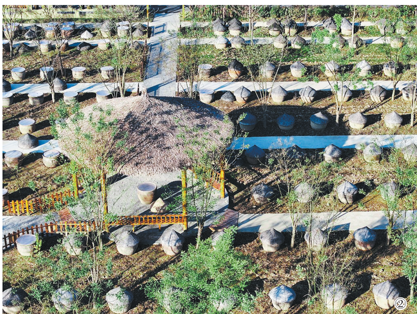
①学徒手持木把翻动缸中酱坯 ②楸树下的酱大缸腌制大缸 ③林下地缸发酵示范园一角 ④腌制好的成武酱大头