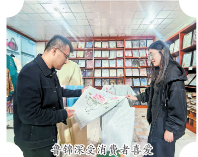
鲁锦深受消费者喜爱