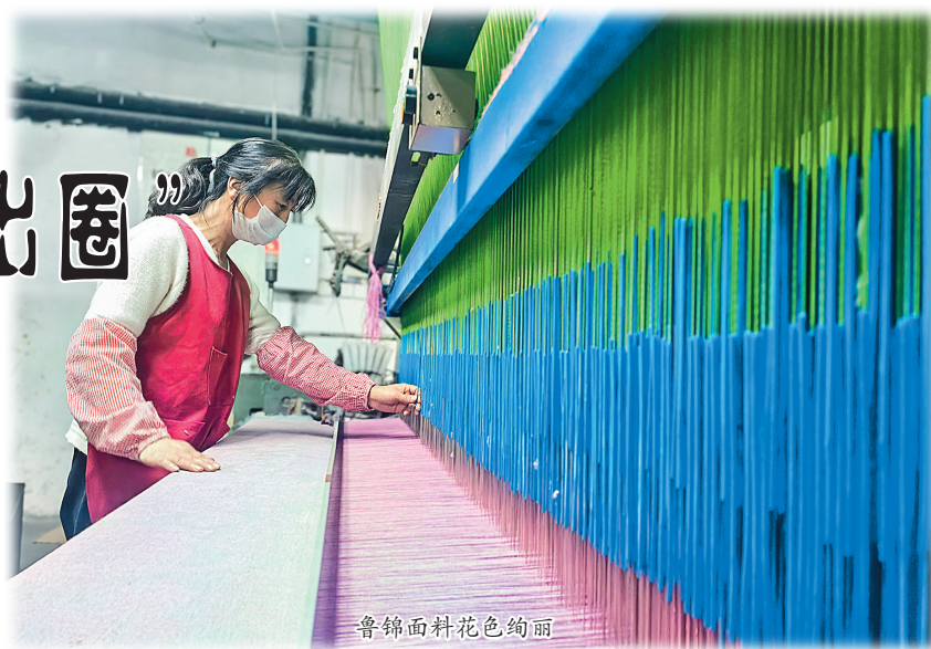
鲁锦面料花色绚丽

此前,相关部门在帮扶指导中发现,作为山东特色产品的鲁锦,长期缺乏一套具有地方特色的专门标准。此次“鲁锦织造技术规范”的立项,正是为了填补这一空白。该项目完成后,将为整个鲁锦产业建立统一的技术标杆,标志着其标准化与规范化发展迈出了至关重要的一步。 从手工作坊的静谧到现代车间的轰鸣,从依赖经验的传承到科学标准的建立,从一门民间技艺到即将拥有省级技术规范,鲁锦的传承之路正越走越宽。它不再仅是记忆中的“老土布”,而是融合了传统韵味与现代审美、兼具实用功能与文化价值的时尚精品。