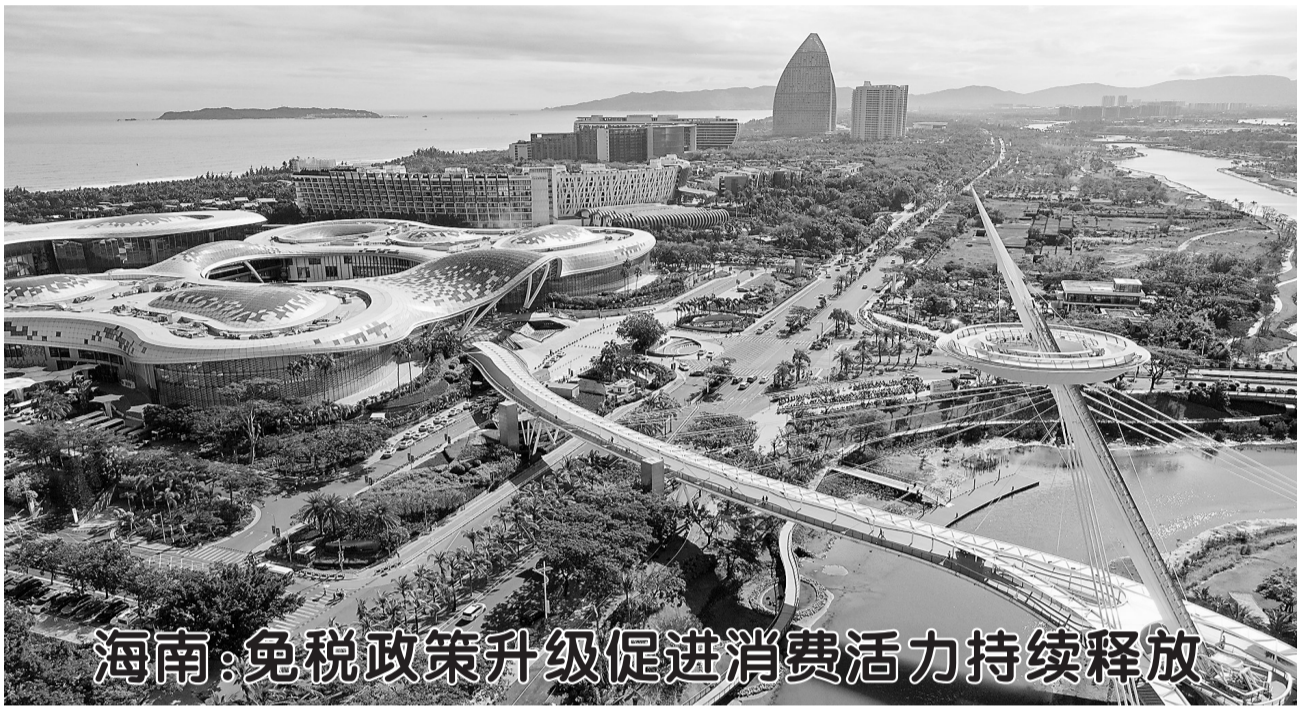
海南:免税政策升级促进消费活力持续释放

目前第2台机组已进入联锁调试阶段,计划明年年初投产发电。该项目全容量投产后,每年预计可减排二氧化碳约186万吨,节约标煤约68万吨,年发电量约70亿千瓦时,可满足600万居民一年用电需求。