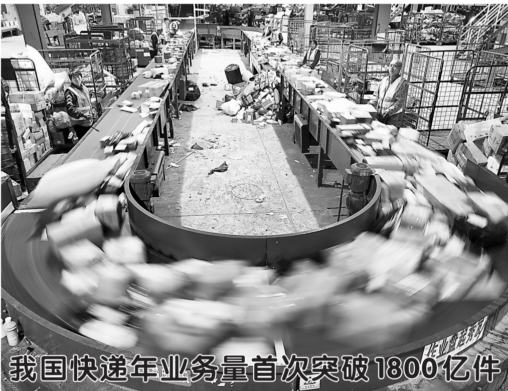
我国快递年业务量首次突破1800亿件