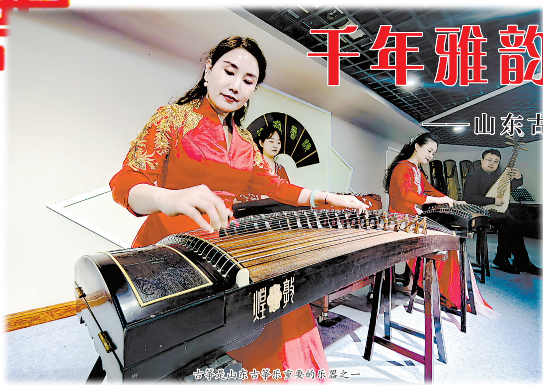
古筝是山东古筝乐重要的乐器之一