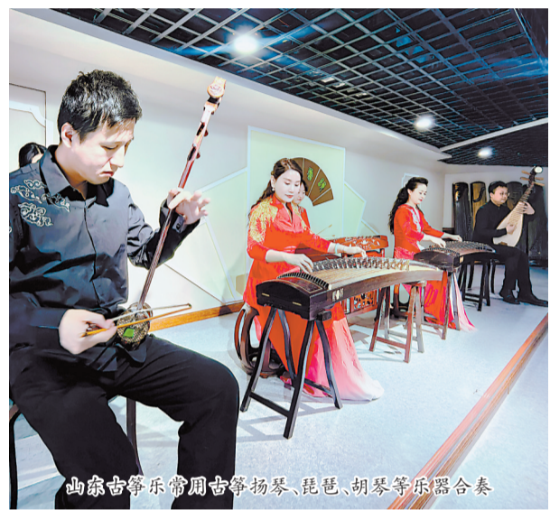
山东古筝乐常用古筝、扬琴、琵琶、胡琴等乐器合奏