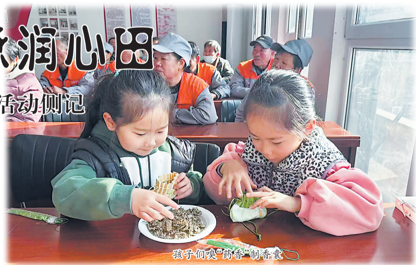
孩子们要“药香”制香囊