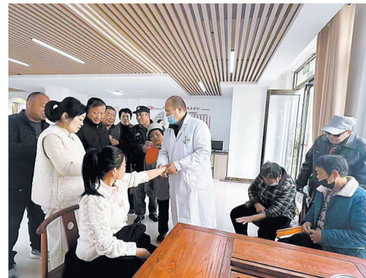
居民体验中医药文化