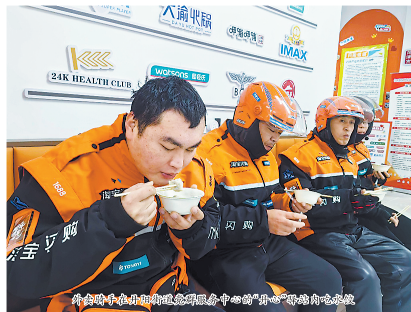
外卖骑手在丹阳街道党群服务中心的“丹心”驿站内吃水饺

冬至前后,鲁西新区丹阳街道组织开展“冬日暖‘新’”行动,为穿梭于城市街巷的快递员、外卖骑手等新就业群体,送去冬日里的关怀与问候。