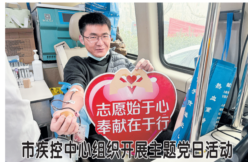
市疾控中心组织开展主题党日活动

12月17日,市疾病预防控制中心开展“主题党日”活动,党员干部积极参与无偿献血。活动现场,党员志愿者有序登记,接受检测、采血,用实际行动践行“人民至上、生命至上”的理念,进一步增强了党组织的凝聚力与战斗力。