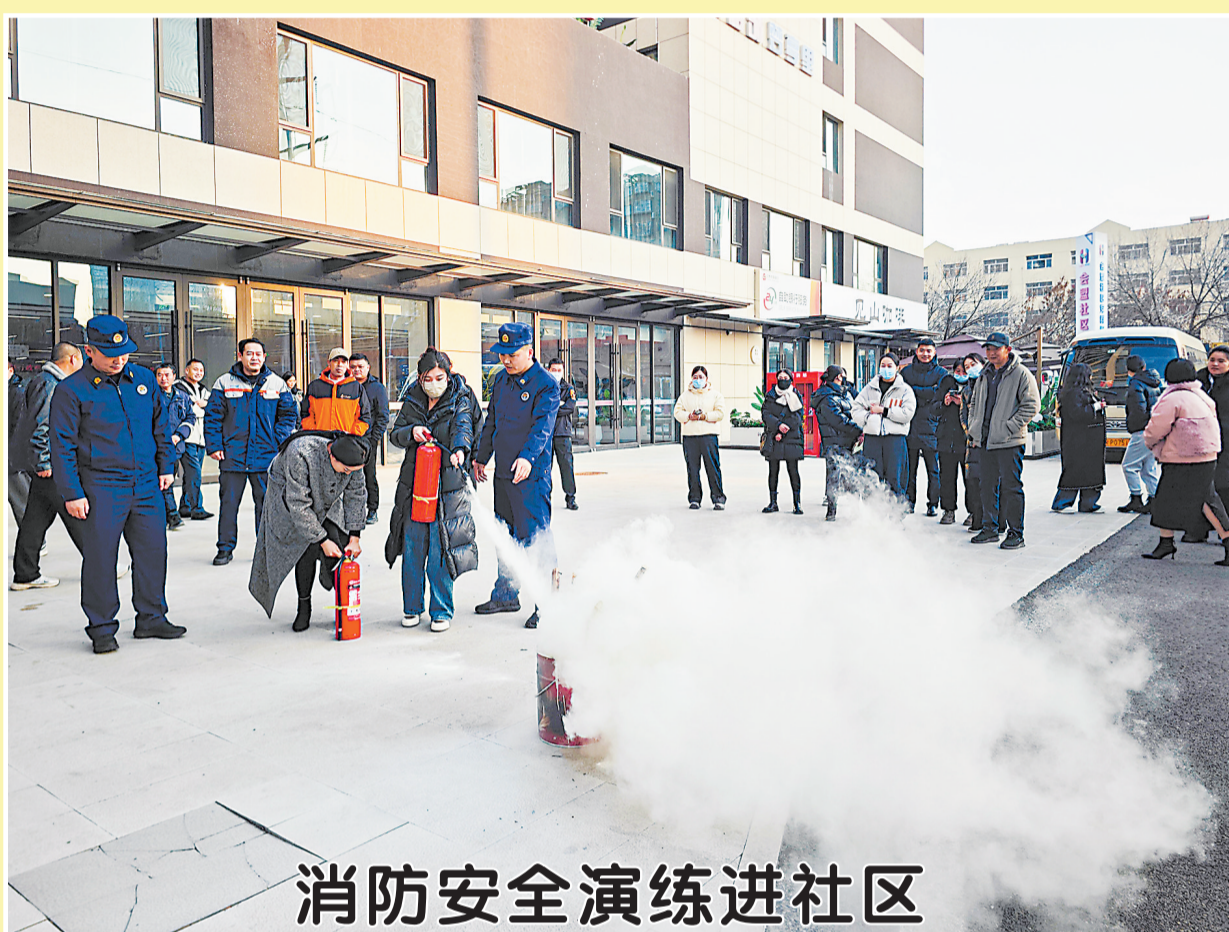
消防安全演练进社区

研究与应用相促进,形成一批高质量研究成果,在推动学校党的建设工作中发挥了积极作用。