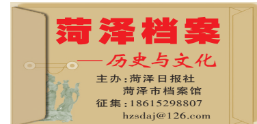
菏泽档案——历史与文化