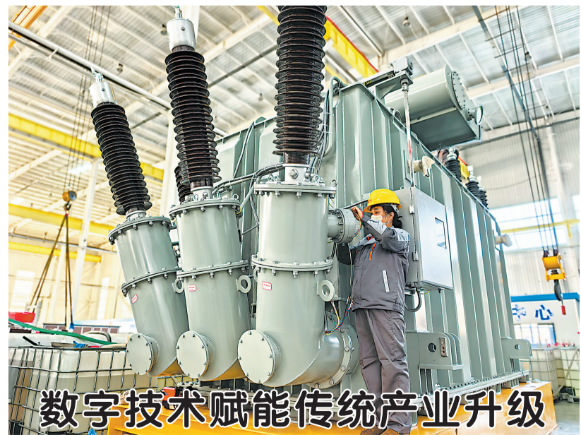
数字技术赋能传统产业升级

企业的快速发展,离不开优质营商环境的坚实保障。郓城县坚持把优化营商环境作为推动经济发展的“生命线”,创新推行“一家企业、一名领导、一个专班、一套方案、一包到底”的包保服务体系,将498家规模以上工业企业全部纳入包保范围,推动惠企政策直达快享、精准滴灌,全力助力企业复工复产、达产达效。 政策红利的持续释放,推动企业技改升级步伐加快。目前,该县鹏远塑业、安迪玻璃等20余个投资超500万元的技改项目顺利推进,预计可带动技改投资超7亿元,同比增长约10%。与此同时,锦联药业、中为电子等一批优质企业加速成长,生物医药、新能源等新兴产业规模持续扩张,产业结构不断优化升级。