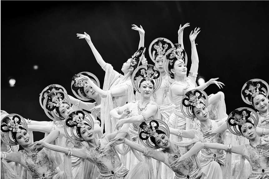
2026如意甘肃·大众文艺全民秀启动

俄外交部长拉夫罗夫25日12月29日说,乌克兰12月28日深夜至29日用91架远程攻击无人机袭击普京官邸于俄西北部诺夫哥罗德州的官邸。