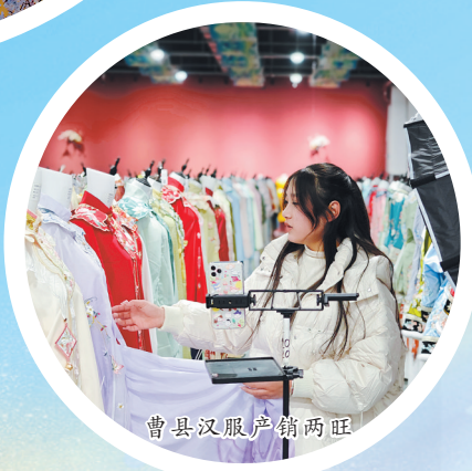
鲁西汉服产业园旺