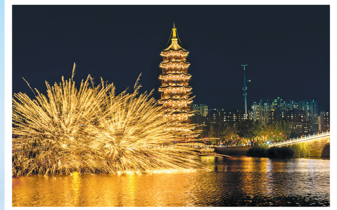
民俗表演打铁花炫彩夺目，丰富了群众文化生活

蓝天白云下，崭新的教学楼美轮美奂；多媒体教室、微机室、多功能报告厅等教学设施一应俱全；音乐、美术、书法等特色课程有序开展；操场上，跳绳、跑步、乒乓球等体育活动热闹非凡……这是东明县黄河镇沙窝镇2号村台尚庄小学的日常景象，也生动勾勒出菏泽“十四五”时期教育发展的民生底色与温暖质感。 五年来，菏泽以促进教育公平、提升教育质量为核心，通过集团化办学、骨干教师交流等一系列扎实举措，推动教育事业从“有学上”“稳步迈向”“上好学”。 资源布局持续优化，城乡教育差距不断缩小。全市累计新建、改建、扩建公办学校（幼儿园）190所，新增学位20.7万个；投入29亿元实施924个乡村教育改善项目，农村中小学100%实现百兆宽带进校园，建成70所公办寄宿制学校。2025年，菏泽新建、改建、扩建中小学14所、幼儿园8所，14个乡镇的寄宿制学校全部开工建设，进一步夯实了教育均衡发展基础。 “五育”并举铸魂育人，促进学生全面发展。菏泽在全省率先实施学校党组织领导的校长负责制，成立思政课程教研室，配备一万多名思政教师，建立35个思政课程精品团队，开展百名思政教师进校园宣讲活动，实现初中、高中全覆盖。推进思政课程改革，打造“行走的思政课”，实施“三百”工程，创建“大思政课程实践基地”，培育思政金课和精品团队，推出一批优秀思政教育工作者。实施“学生体质健康计划”，推动各地增加体育课时、丰富体 育课后服务和课后活动，落实中小学生每天综合体育活动时间两小时的要求。针对“小胖墩”“小眼镜”等影响青少年身心健康的突出问题，加强体育、美育和学生心理健康教育，制定中小学劳动教育工作方案，严格落实每周一节劳动课、每学期一个劳动周的要求。 改革创新激活动能，教育发展续写新篇。普惠性幼儿园覆盖率95.58%，义务教育集团化、联盟化覆盖率超过80%，19个省级、52个市级“强镇筑基”试点镇持续巩固提升。高中教育形成“特色学科+高中”发展模式，本科录取率连续三年大幅增长。职业教育新增29个与产业发展相关的专业，通过“四共”（共定目标、共编课程、共享教学、共拓就业）订单培养模式，毕业生就业率达97%，连续三年荣获全国技能大赛金奖；高校专业建设与校区建设持续取得突破，16所特殊教育学校获评省级示范校。 师资队伍夯实根基，教师队伍素养稳步提升。2025年，菏泽招聘教师350人，引进人才890人，安公费师范生372人；实施“三名”工程，开展“学政理论、学业知识、学先经验、抓能力提升”和“教师心回学校、校长走上讲台、教研主任组课、有职称有良心”等主题活动，推动职称评定与教学实绩挂钩，着力打造高素质专业化教师队伍。 从乡村到城区，从学前教育到高中阶段教育，菏泽教育实现了从规模扩张到质量提升的跨越式发展，让“上好学”的民生愿景照进现实。