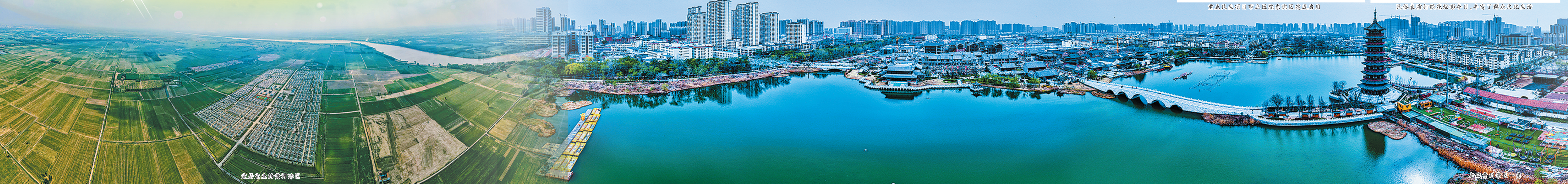
宜居宜业的黄河新城