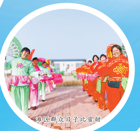
非遗群众日子比蜜甜