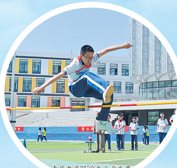
素质教育促进学生全面发展