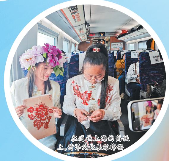
在绣娘手巧的针线中，特色产业绽放异彩