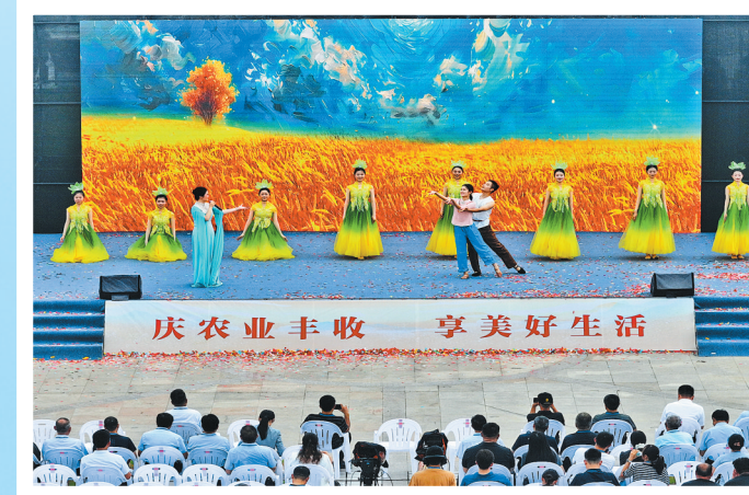
庆丰收 享美好生活

蓝天白云下，崭新的教学楼美轮美奂；多媒体教室、微机室、多功能报告厅等教学设施一应俱全；音乐、美术、书法等特色课程有序开展；操场上，跳绳、跑步、乒乓球等体育活动热闹非凡……这是东明县黄河镇沙窝镇2号村台尚庄小学的日常景象，也生动勾勒出菏泽“十四五”时期教育发展的民生底色与温暖质感。 五年来，菏泽以促进教育公平、提升教育质量为核心，通过集团化办学、骨干教师交流等一系列扎实举措，推动教育事业从“有学上”“稳步迈向”“上好学”。 资源布局持续优化，城乡教育差距不断缩小。全市累计新建、改建、扩建公办学校（幼儿园）190所，新增学位20.7万个；投入29亿元实施924个乡村教育改善项目，农村中小学100%实现百兆宽带进校园，建成70所公办寄宿制学校。2025年，菏泽新建、改建、扩建中小学14所、幼儿园8所，14个乡镇的寄宿制学校全部开工建设，进一步夯实了教育均衡发展基础。 “五育”并举铸魂育人，促进学生全面发展。菏泽在全省率先实施学校党组织领导的校长负责制，成立思政课程教研室，配备一万多名思政教师，建立35个思政课程精品团队，开展百名思政教师进校园宣讲活动，实现初中、高中全覆盖。推进思政课程改革，打造“行走的思政课”，实施“三百”工程，创建“大思政课程实践基地”，培育思政金课和精品团队，推出一批优秀思政教育工作者。实施“学生体质健康计划”，推动各地增加体育课时、丰富体 育课后服务和课后活动，落实中小学生每天综合体育活动时间两小时的要求。针对“小胖墩”“小眼镜”等影响青少年身心健康的突出问题，加强体育、美育和学生心理健康教育，制定中小学劳动教育工作方案，严格落实每周一节劳动课、每学期一个劳动周的要求。 改革创新激活动能，教育发展续写新篇。普惠性幼儿园覆盖率95.58%，义务教育集团化、联盟化覆盖率超过80%，19个省级、52个市级“强镇筑基”试点镇持续巩固提升。高中教育形成“特色学科+高中”发展模式，本科录取率连续三年大幅增长。职业教育新增29个与产业发展相关的专业，通过“四共”（共定目标、共编课程、共享教学、共拓就业）订单培养模式，毕业生就业率达97%，连续三年荣获全国技能大赛金奖；高校专业建设与校区建设持续取得突破，16所特殊教育学校获评省级示范校。 师资队伍夯实根基，教师队伍素养稳步提升。2025年，菏泽招聘教师350人，引进人才890人，安公费师范生372人；实施“三名”工程，开展“学政理论、学业知识、学先经验、抓能力提升”和“教师心回学校、校长走上讲台、教研主任组课、有职称有良心”等主题活动，推动职称评定与教学实绩挂钩，着力打造高素质专业化教师队伍。 从乡村到城区，从学前教育到高中阶段教育，菏泽教育实现了从规模扩张到质量提升的跨越式发展，让“上好学”的民生愿景照进现实。