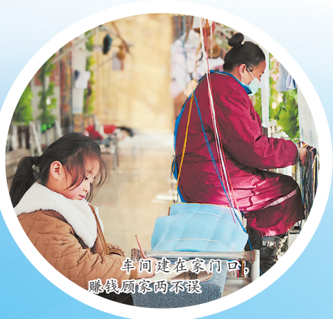
家门口就能充电，技能培训不停歇