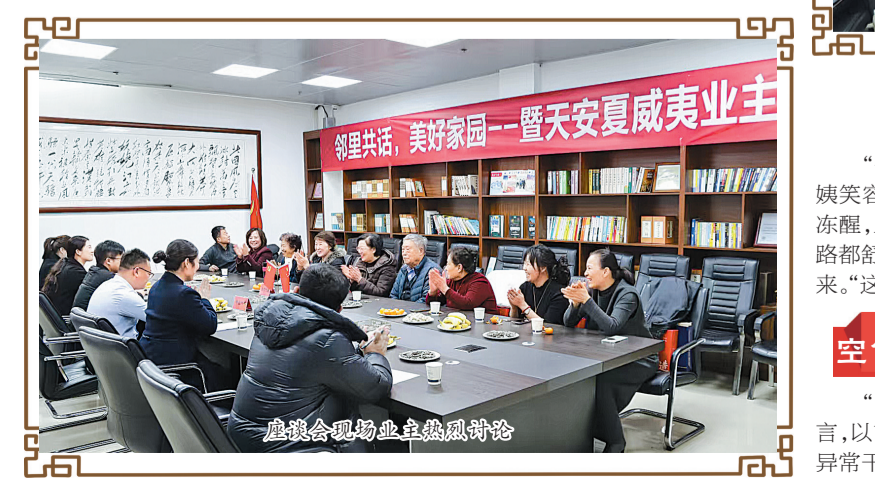
座谈会现场业主热烈讨论

为代表多层次技能人才梯队，围绕“河道修理工”这一核心工种，构建起“技艺传承、技术攻关、人才孵化”三位一体的培养体系。依托企业首席技师工作室，培训覆盖6个治黄关键工种，并在黄河菏泽段“游荡型河段”的险工加固、导导工程维护等方面形成了显著技术优势。