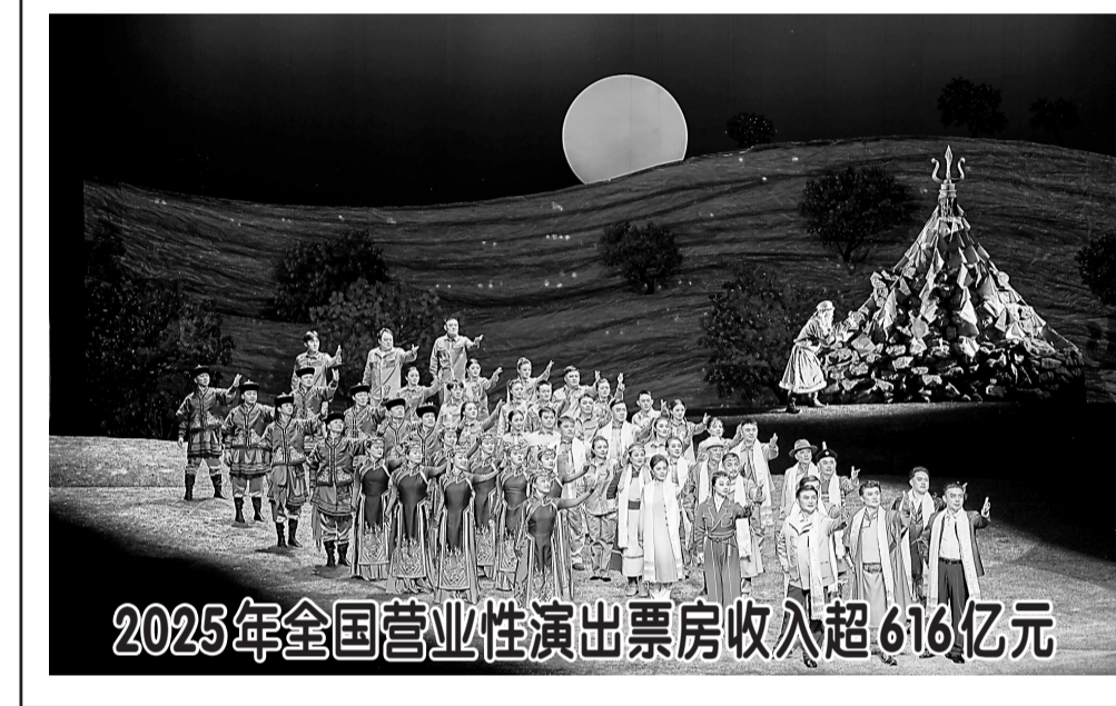
2025年全国营业性演出票房收入超616亿元