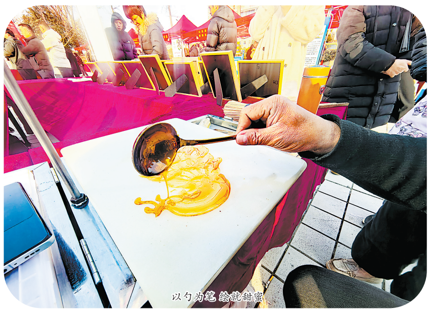
以勺为笔 绘就甜蜜