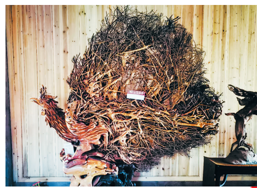
①刘峰引导顾客欣赏根艺作品 ②精雕细琢 ③根艺作品《孔雀》