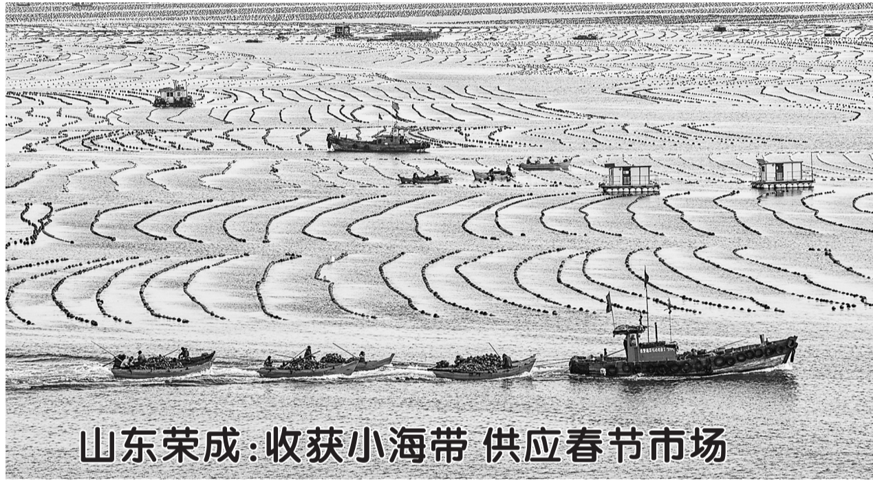
山东荣成:收获小海带 供应春节市场