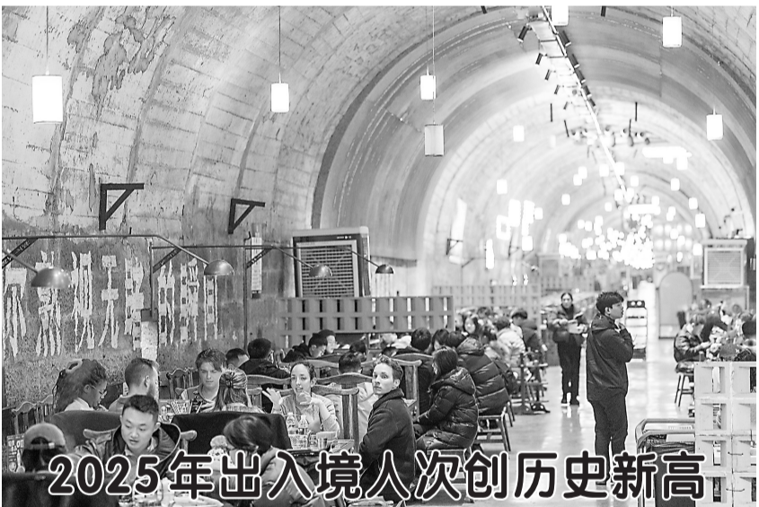
2025年出入境人次创历史新高

本篇”系列报道。该书从中选取了40篇新华社记者深度调研报道,涉及东中西部区位和资源禀赋各不相同、产业发展各具特色的县(区、市),生动讲述了这些地区在压力挑战下逆势突围、开拓创新、转型升级的鲜活故事,以扎实调研描摹出中国县域经济图景,展现出中国经济广阔的发展空间,以及强大的韧性和活力。