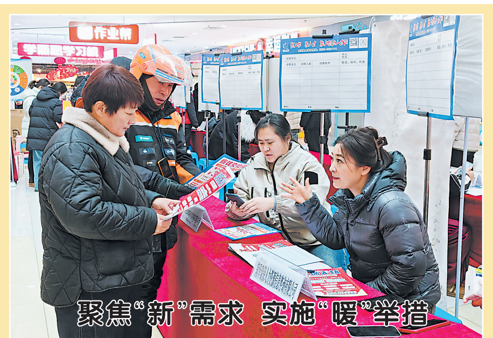
聚焦“新”需求 实施“暖”举措

连日来,聚焦新兴领域发展需求与新就业群体求职诉求,我市各县区积极搭建对接平台,提供多元化就业服务与政策支持,既有效缓解了企业用工需求,又为重点求职群体拓宽了就业渠道,实现了企业用工、群众就业、新兴领域发展的三方共赢。