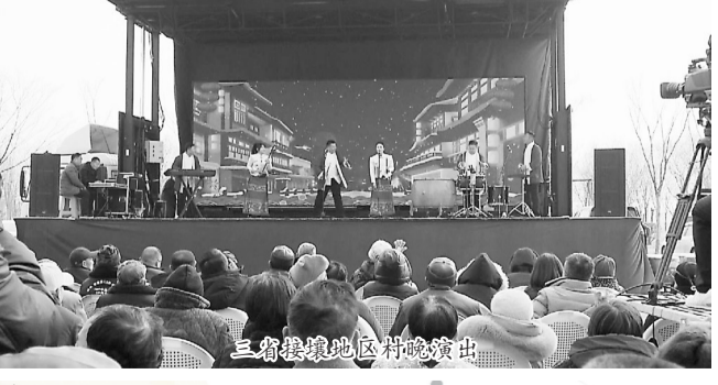
三省接壤地区村晚演出