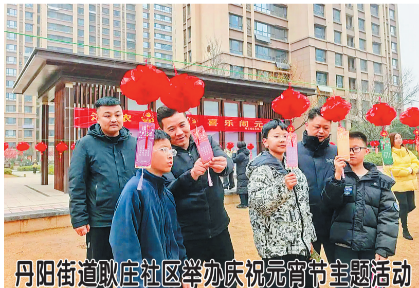
丹阳街道耿庄社区举办庆祝元宵节主题活动 ▲3月3日,鲁西新区丹阳街道耿庄社区在国府大院小区举办“我们的节日·元宵”主题活动。活动通过猜灯谜、品汤圆、团拜联谊等形式,让居民在家门口感受传统民俗魅力,共叙邻里温情。此次元宵节活动,既弘扬了中华优秀传统文化,又拉近了党群、邻里、物业与居民之间的距离,丰富了居民精神文化生活,提升了群众的获得感、幸福感和归属感。

作教学结束后,比拼活动火热开启,11名选手同台竞技,比拼技艺,最终评选出一、二、三等奖,获奖选手所在桌全体成员共享喜悦与奖品。活动尾声,男女对唱《不忘初心》深情悠扬,为整场活动画上圆满句号。此次活动以传统节日为契机,将民俗体验、趣味互动与职工关怀深度融合,既让广大职工在动手实践中感受元宵节的文化内涵,也进一步增强了彼此间的交流与情谊。活动的成功举办,丰富了职工精神文化生活,凝聚了奋进力量,充分彰显了工会组织服务职工、凝聚人心的责任担当,为新的一年各项工作开展注入温暖与动力。