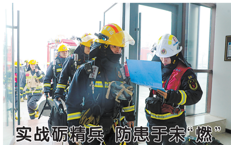
实战砺精兵 防患于未“燃”

近日,菏泽鲁西新区消防救援大队组织开展高层建筑大型实战化救援演练。演练现场模拟高层办公区域突发火情,火势伴随有毒烟气快速蔓延,救援力量接到指令后迅速集结,科学划分侦察、搜救、灭火、供水等作战单元,依托云梯车、热成像仪等装备,同步开展内攻搜救、高空转移、远程供水等战术动作,高效完成人员疏散与火场扑救任务。演练结束后,现场召开讲评会,全面复盘处置流程,优化作战方案,并向物业及员工普及火场逃生与器材使用常识。此次演练有效检验了多班组协同作战能力,进一步完善了高层建筑灭火救援预案。