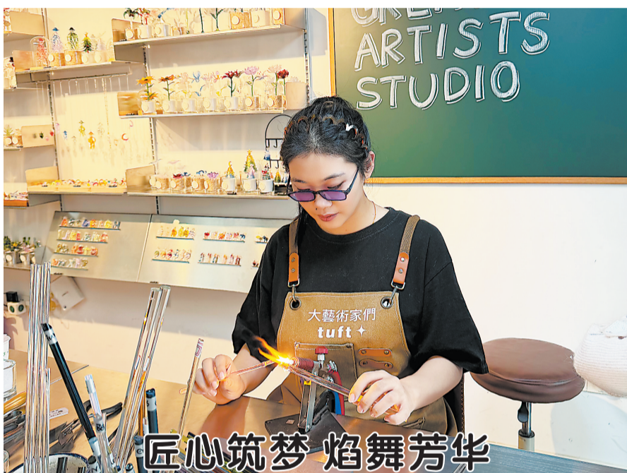
匠心筑梦 焰舞芳华

3月6日,中建建筑港五公司以“巾帼心向党,实干开新局”为主题,组织女职工开展“匠心筑梦,焰舞芳华”手工玻璃技艺体验活动,庆祝“三八”国际劳动妇女节。此次活动不仅为忙碌在工作一线的女职工送去关怀,帮助她们舒缓压力、收获手工创作的成就感,更将玻璃烧制技艺中“千度淬炼、精益求精”的工匠精神与岗位实践深度融合。女职工们在体验“火中雕塑”的过程中,深刻感悟到成长与坚守的意义,这既彰显了公司对女职工的人文关怀,也进一步凝聚了巾帼力量,激励全体女职工以更昂扬的姿态践行实干担当,为企业高质量发展注入坚实的“她力量”。