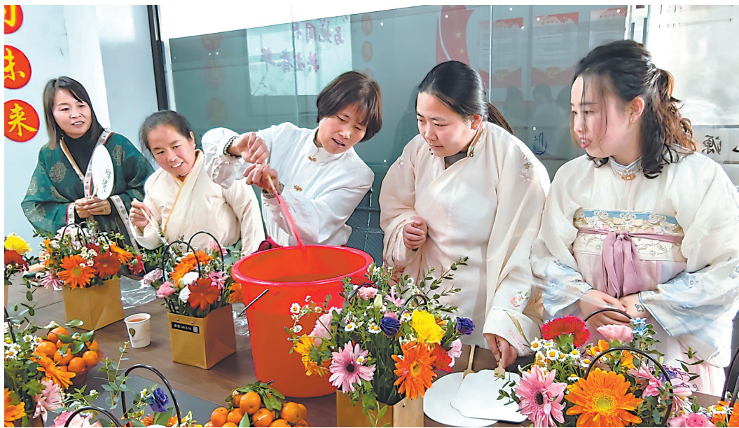
3月6日，定陶区工商联组织部分女同志走进商会企业，与女企业家、女职工共同庆祝“三八”国际劳动妇女节。大家身着汉服，参与插花、非遗漆扇制作等体验，在放松心情的同时，进一步激发了商会内生动力，凝聚起巾帼奋进力量。

孟海镇党委书记倪博闻表示，乡村振兴的关键在于打破“一亩三分地”的思维定式，让党建成为串起资源、凝聚合力的“红纽带”。 通讯员 郭亚宁 记者 刘卫国