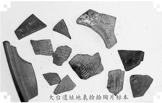
大台遗址地表拾得陶片标本

在成武县,有一座当地人人口中的“大台”。它不高,却厚重;不大,却绵长。这座占地约1万平方米的土台,既非山峦,也非单纯建筑,而是一处承载着从新石器时代至今、跨越数千年人类记忆的文化遗址。