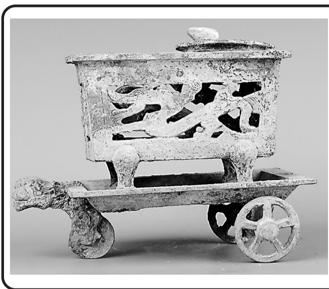
东汉镂空龙虎纹铜染炉,既是一件饮食器具,也是一件浓缩的汉代文明史。它让我们看到贵族席地而坐、分餐而食的生活场景,感受到古人对精致生活的追求,也触碰到那个时代的精神脉搏。其独特的双锅设计、三轮结构、精美纹饰,在同类器物中独树一帜,为研究汉代社会、科技与艺术,提供了珍贵的实物见证。透过这件小小的铜染炉,我们得以品味“舌尖上的汉代文明”,感受两千年前那片土地上的烟火气息与文化传承。

“染炉”名称的确定,经历了学术界长期探讨。所谓“染”,据《吕氏春秋》记载:“染,菹酱也”,指古人对调味品的统称。在汉代,“染”主要指以酱、盐、豉等为主的调味品,加热后食用风味更佳,故有“酱不热不香”的饮食习俗。